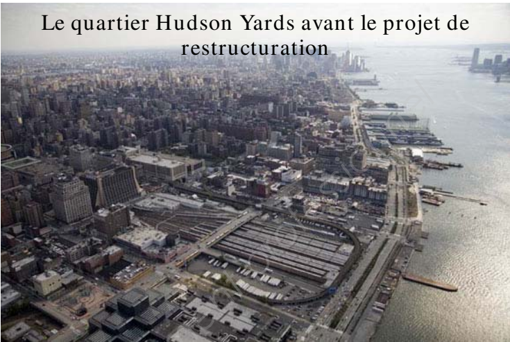
Le quartier Hudson Yards avant le projet de restructuration