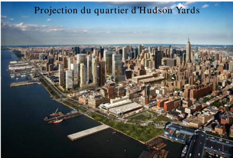
Projection du quartier d'Hudson Yards

Le dernier grand projet en cours à Manhattan est celui d'Hudson Yards : (...) cette friche ferroviaire doit devenir une extension du CBD. [...]. Les acteurs urbains de la ville globale, anxieux de soutenir son développement économique et son image, mettent ainsi l'accent sur de grands projets destinés à attirer l'investissement. Ce futur quartier durable comprendra des logements, des bureaux, des boutiques, un hôtel de luxe, des lieux culturels et des espaces verts. Il sera intégré à l'Hudson Park et sa voie cyclable (une des plus grandes de NYC) ainsi qu'à la High Line.